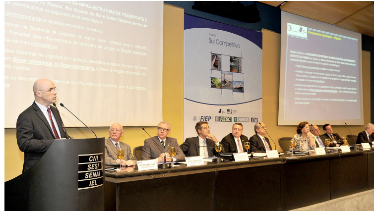
Evento contou com a presença do governador Raimundo Colombo, da ministra Ideli Salvatti, de parlamentares e de lideranças da indústria dos três estados

■ Ferrovários - Adequação da Ferrovia ALL entre Mafra e São Francisco do Sul; Construção dos Contornos Ferroviários de Jaraguá do Sul, de Joinville e de São Francisco do Sul; Construção da Ferrovia Norte-Sul entre Panorama e Rio Grande (passando pelos três